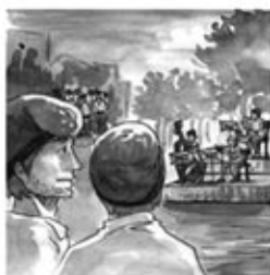
7. La barretina pels nois, i dansen tots ben cofois.