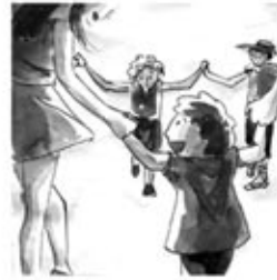
14. Rics, pobres, petits i grans dansen donant-se les mans.