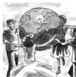
23. Quan ella envolta el món, tots els dansaires hi són.