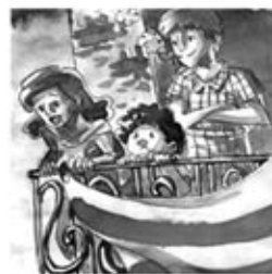
4. Quan la sardana entra en dansa, el veïnatge s'hi atansa.