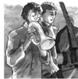
12. Contraaix, fiscorn i tible, trombó i trompeta que fibla.