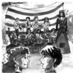
9. Els músics formen cobla i toquen amb aire noble.