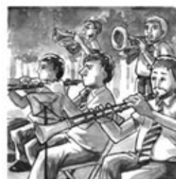
10. Vet aquí cada instrument : Un de corda, nou de vent.