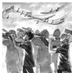
3. escampant notes pels aires. Ara vénen els dansaires.