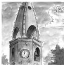
2. Al darrer toc de campanes, comencen ja les sardanes...