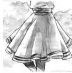
18. Que deixant el contrepàs la sardana allargà un pas.