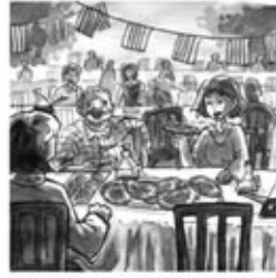
20. car ha treballat tot l'any per la sardana, amb afany.