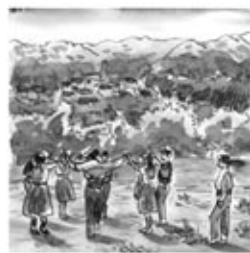
24. La sardana catalana, és la dansa més ufana !