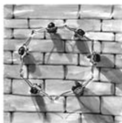
1. Sardana, ball circular honora l'astre solar.