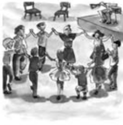
15. Creix i creix més la rotllana, que agombola i agermana.