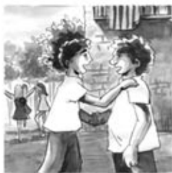
5. A uns, la dansa els agrada, pels altres és la trobada.