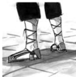
8. L'espardenya en la sardana és un calçat com Déu mana.