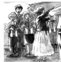
22. Les sardanes cantades fan parlar les trobades.