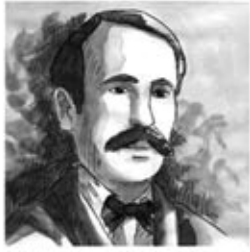
17. Pensem a en Pep Ventura i sa musical cultura.