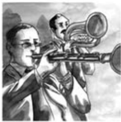
13. L'instrument rei, la tenora, dona el to mentre plora.