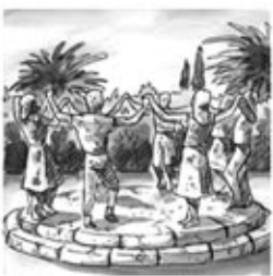
21. El poble ben amatent li ha bastit un monument.