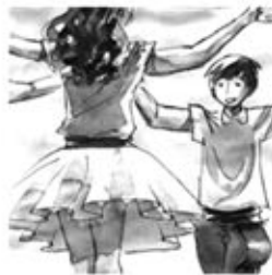
6. Moltes colles als aplecs, faldilles sense rebreçs.