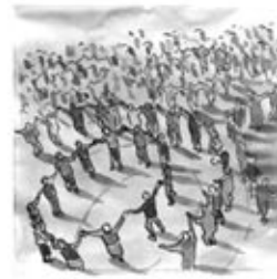
16. Si la roda s'agrandeix, un cercle es crea al seu eix.