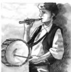
11. El tamborí, percussió, i el flabiol, el companyó.