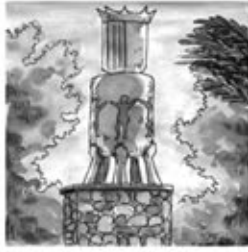
19. Avui, la Ciutat Pubilla és una vila que brilla,